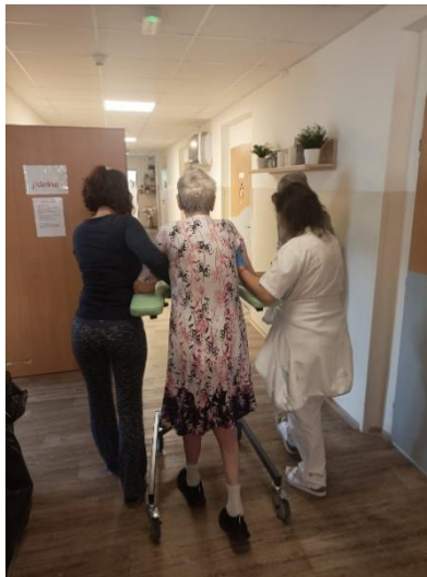
Nácvik chůze s vysokým chodítkem

Rozsah a forma fyzioterapie a ergoterapie jsou vždy přizpůsobeny aktuálním možnostem, zdravotnímu stavu klienta a časovým možnostem fyzioterapeuta.