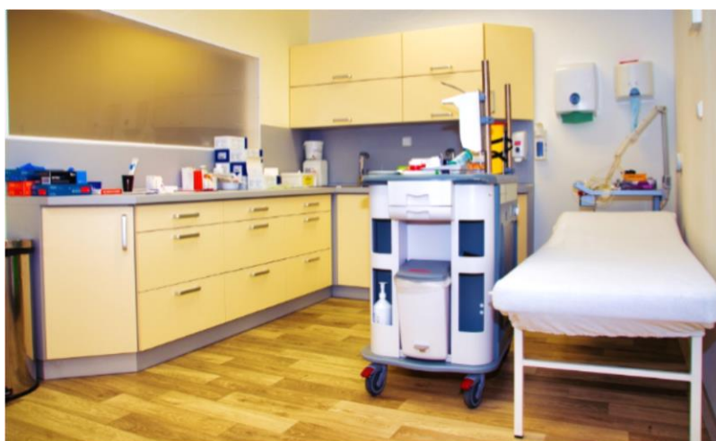
Denní místnost zdravotnického personálu

Rozsah poskytovaných zdravotních úkonů odpovídá charakteru pobytové sociální služby a nelze jej zaměňovat za komplexní zdravotnickou péči poskytovanou ve zdravotnickém zařízení. Domov není zdravotnickým zařízením ani hospicem.